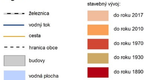
Obr. 1. Kartografické zobrazenie historicko-geografického vývoja obce Šenkvice Vlastné spracovanie stavebno-morfologického vývoja obcí metódou intervalových polygónov.